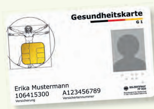
Nimûneyek kerteke tendurustiyê

Ji kerema xwe herdem kerta elektrônîk (elektronische Gesundheitskarte) di gel xwe bibe, eger hun bixwazin xizmetên tendurustî bistînin. Ji 1. Çile. 2015 tenê ew kert mîna belgeya nameyeke pêbawer e, ji bo bikaribe xizmetguzariya sîgorteya nexweşiyê ya yasayî li gor daxwaza xwe werbigire. Li ser kerta we ya elektrônîk agahî li ser navê we, roja jidayîkbûnê û navnîşana we û her wisa jî numera we ya sîgorta tendurustiyê û rewşa sîgortekirina we (endametî, bi malbatî sîgortekirî ye an xaneneşîn) weke pêzanînên mecbûrî bêne parastin. Ev kerta elektrônîk ya tendurustiyê ji bilî wan wêneyekî we jî li ser heye.