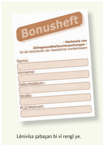
Lênivîsa şabaşan bi vî rengî ye.

Diranên saxlem parçeyek in ji qalîteya jiyane ne. Ji ber wê jî bi şeweyekî berdewam pişkinîna wan giring e, eger we çu gazinde û êş jî ji diranên xwe nebin. Qasa sîgorta tendurustiyê ya yasayî hemî mesref û xerciyên xizmetguzariya pişkinîne jî bi xwe digire. Ev pişkinîn jî dibin alîkar, bo hin nexweşiyên destnişankirî, ku berwext bêne diyarkirin û naskirin û her weha dermankirin. Hun dikarin ji sîgorta xwe ya nexweşiyê wek tê gotin “lênivîsa şabaşan” (Bonusheft) werbigirin. Di wê lénivîsê de pişkinînen we yên hun bikin tene nivîsin. Eger hun bikaribin, ku we bi kêmanî salê carekê (di bin 18 salî re bi kêmanî her niv salê carekê) diyar bikin, ku we seredana bijîjkeka diranan an bijîjkekî deranan kiriye, wê qasa sîgorta we ya nexweşiyê perene zêde di ser re bide, eger şûndiraneke pêdivî be.