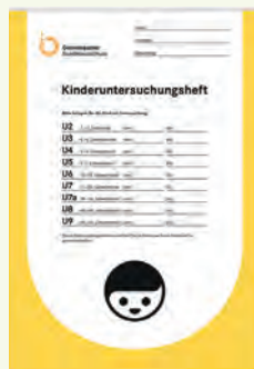
Lênivîsa pişkinînan (U-Heft) bi vî rengî ye.

Ev pişkinînen han zor giring in. Ji kerema xwe re, ji ber wê hindê pêdivî ye, ku hun pişkinînan bi cedî bistînin û herdem di gel xwe wê lênivîsa pişkinînan (U-Heft) û lênivîsa vaksînlêdanê ya zaroka xwe bînin. Ew pişkinîn ji bo tendurustiya zaroka we ye.