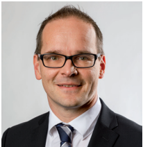
Grant Hendrik Tonne Niedersächsischer Kultusminister

Auf dieser Grundlage werden Sie eine fundierte Entscheidung für den weiteren Bildungsweg Ihres Kindes treffen können. Ein glückliches Kind, das den Anforderungen der gewählten Schulform motiviert begegnet, sollte das gemeinsame Ziel sein.